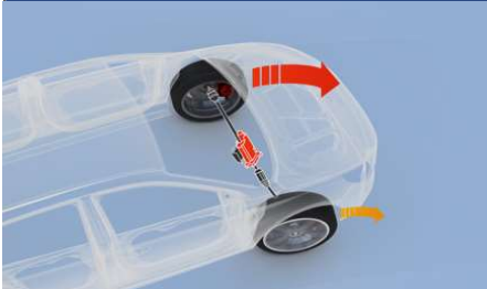
Mechaninis riboto slydimo diferencialas (m-LSD)