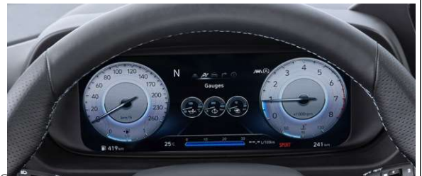
„N-Grip“ pavara valdymo sistema, 6 važinimo režimai, starterio komanda sistema, sūkių suderinimo funkcija žeminant pavaras