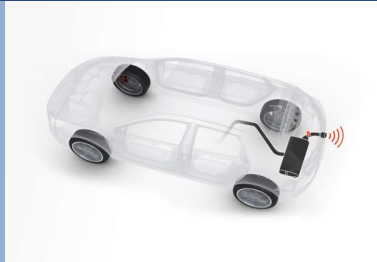
Reguliuojamas duslintuvo garsas