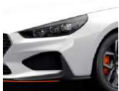
„Polar White“ balta (PYW)