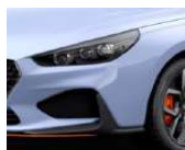
„Performance Blue“ mėlyna (XFB)