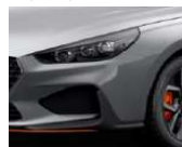
„Dark Knight“ pilka (YG7)

HYUNDAI pasilieka teisę iš anksto nepranešusi keisti kainą ir specifikacijas.