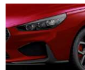
„Sunset Red“ raudona (WR6)