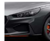
„Phantom Black“ juoda (PAE) perlamutrinė