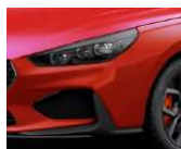
„Engine Red“ raudona (JHR)