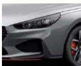
„Shadow Gray“ pilka (TKG)