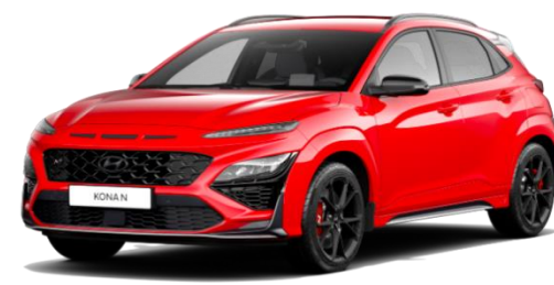
„Ignite Flame“ raudona (WR7) Nemokama