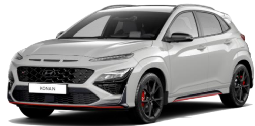
„Cyber Gray“ pilka (C5G) Metalizuota