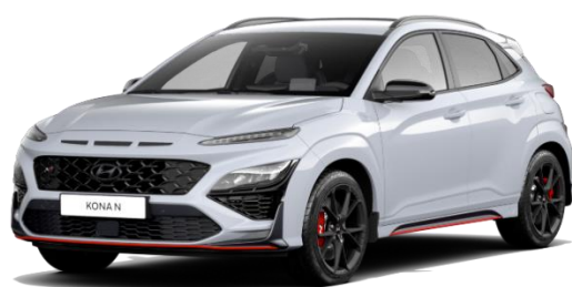
„Sonic Blue“ mėlyna (PYU) Speciali spalva