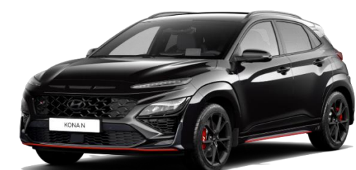
„Phantom Black“ juoda (MZH) Perlamutrinė