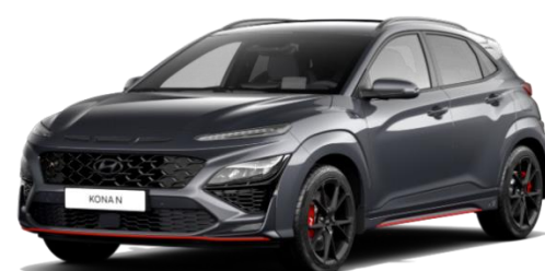
„Dark Knight“ pilka (Y7G) Perlamutrinė