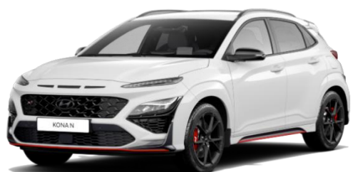
„Atlas White“ balta (SAW) Speciali spalva

Metalizuoti, perlamutriniai dažai arba speciali spalva: kaina 395 €