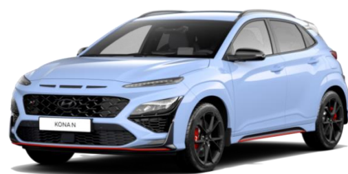
„Performance Blue“ mėlyna (SFB) Speciali spalva

HYUNDAI pasilieka teisę iš anksto nepranešusi keisti kainą ir specifikacijas. Visos nuotraukos yra tik iliustracija. Pristatyto automobilio įranga ir spalvos gali skirtis. Hyundai MotorBaltic Oy