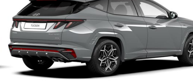
Shadow Gray/ Phantom Black Roof (TK1) (N Line only)