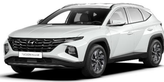
Atlas White Special colour