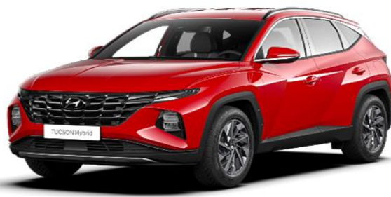
Engine Red (JHR) Solid Free of Charge