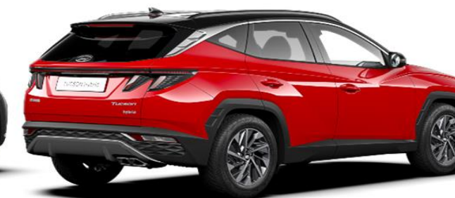
Engine Red/ Phantom Black Roof (JH1)