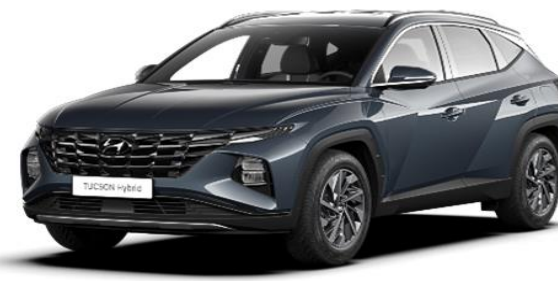
Teal (TG8)* Metallic Paint