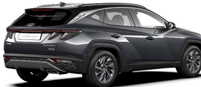
Dark Knight/ Phantom Black Roof (YG1)