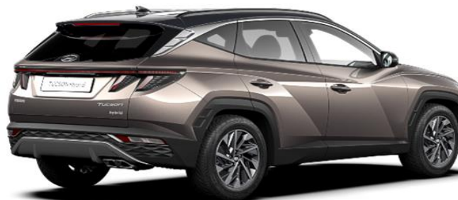
Silky Bronze/ Dark Knight Roof (B6C)*