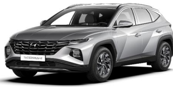
Shimmering Silver (R2T) Metallic Paint