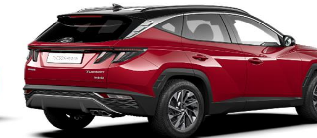
Sunset Red/ Phantom Black Roof (WRT)