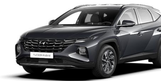
Dark Knight (YG7) Pearl