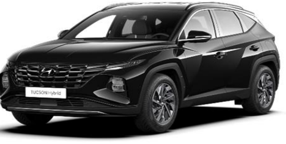
Phantom Black (PAE) Pearl