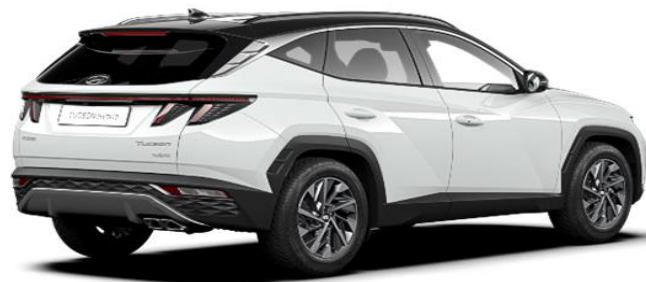
Atlas White / Phantom Black Roof