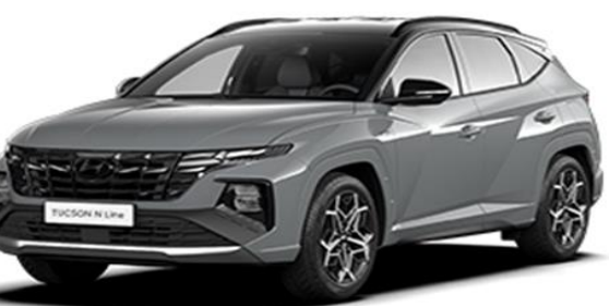
Shadow Gray (TKG) Special Colour (N Line only)