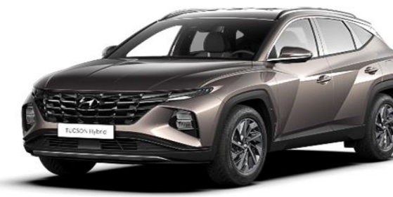
Silky Bronze (B6S)* Metallic Paint