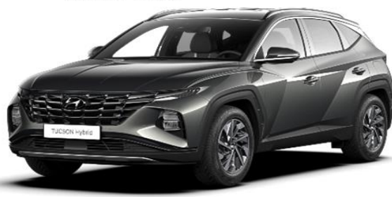
Amazon Gray (A5G)* Metallic Paint