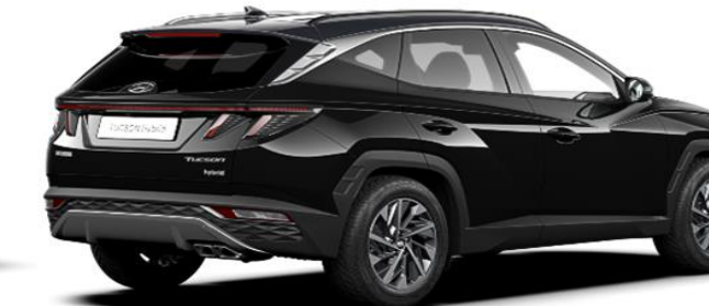
Phantom Black/ Dark Knight Roof (PA9)*

*Nėra „N Line“ modeliuose Automobiliuose su „Comfort“ lygio įranga ir modelyje su panoraminis stoglangiu nėra „Phantom Black“ juodos spalvos stogo.