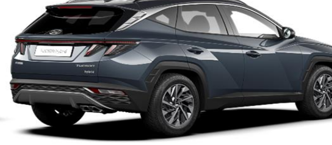
Teal/ Dark Knight Roof (TG1)*