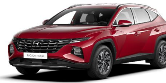
Sunset Red (WR6) Pearl