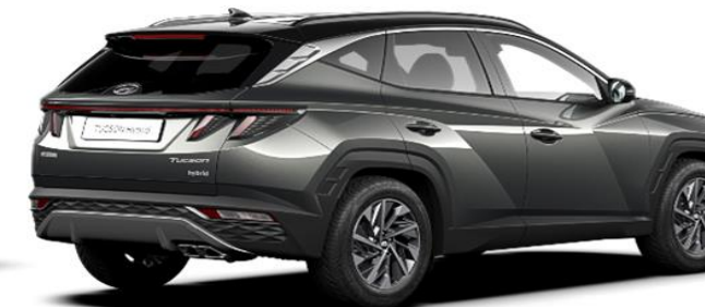
Amazon Gray/ Phantom Black Roof (A51)*