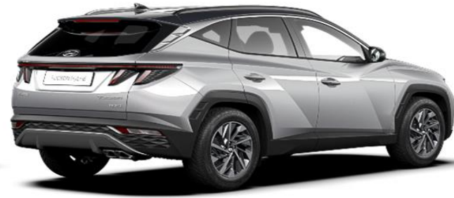
Shimmering Silver/ Dark Knight Roof (R2C)*