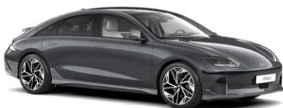
„Nocturne Grey“ pilka matinė (T9M)