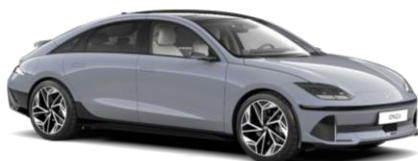
„Transmission Blue“ mėlyna perlamutrinė (NY9)