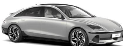
„Gravity Gold“ auksinė matinė (W3T)