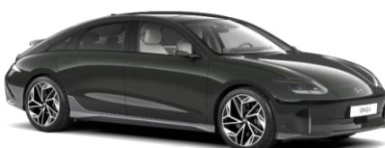
„Digital Green“ žalia perlamutrinė (RG9)