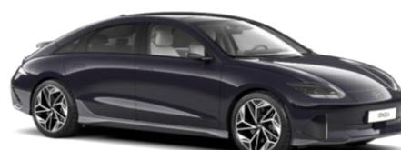
„Biophilic Blue“ mėlyna perlamutrinė (XB9)