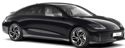
„Abyss Black“ juoda perlamutrinė (A2B)

"Solid" spalva "Byte Blue" 0 € „Metallic“ spalva 490 € „Matinė“ spalva 890 €