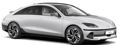
„Curated Silver“ sidabrinė metalizuota (R9S)