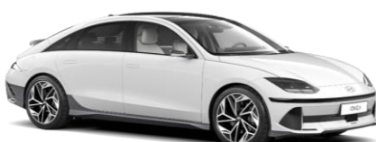
„Serenity White“ balta perlamutrinė (W6H)

Realiai faktinis nuvažiuojamas atstumas priklauso nuo vairavimo stiliaus, greičio, komforto ir (arba) antrinių prietaisų naudojimo, lauko temperatūros, keleivių skaičiaus ir (arba) papildomo krovinio bei vietovės reljefo. Kiekvienam automobiliui nurodomas orientacinės nuvažiuojamo atstumo ribos, kuriose vidutiniškai per metus turėtų važinėti 80 % mūsų klientų. Šį atstumą gali gerokai sutrumpinti važiavimas dideliu greičiu greitkeliais ir žiemą žemoje temperatūroje. Didžiausias įkrovimo greitis gali būti mažesnis už įkrovimo stotelės didžiausią įkrovimo greitį. Pavyzdžiui, jums nepavyks įkrauti automobilio 350 kW greičiu, nors įkrovimo stotelė tiekia 350 kW. Įkrovimo greitis taip pat priklauso nuo akumuliatoriaus būklės, jo temperatūros ir aplinkos oro temperatūros.