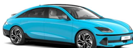
„Byte Blue“ mėlyna perlamutrinė (UCB)