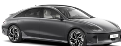
„Nocturne Grey“ pilka metalizuota (T2G)