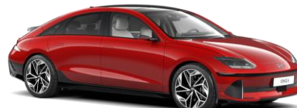
„Ultimate Red“ raudona metalizuota (R2P)