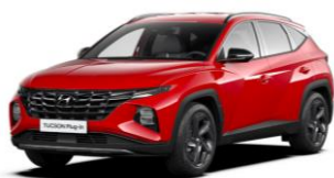
"Engine Red" (JHR)