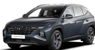
"Dark Teal" - metalizuota "Abyss Black" - juodas stogas (TG0)