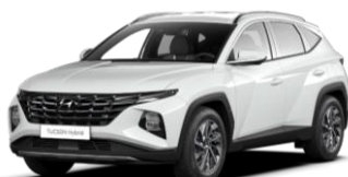
"Atlas White" (SAW)