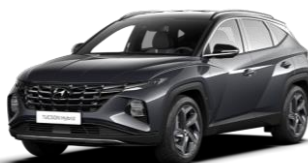
"Dark Knight Gray" perlamutrinė "Abyss Black" - juodas stogas (YG0)