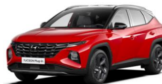
"Engine Red" (JH0) "Abyss Black" - juodas stogas