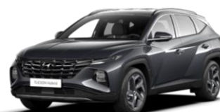
"Dark Knight Gray" (YG7) perlamutrinė