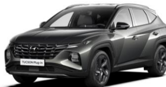
"Shimmering Silver" - metalizuota "Abyss Black" - juodas stogas ( R24)