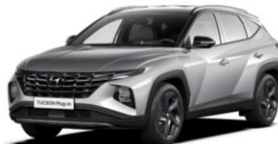
"Shimmering Silver" (R2T) metalizuota