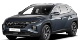
"Dark Teal" (TG8), metalizuota