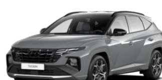
"Shadow Gray" (TKG)*