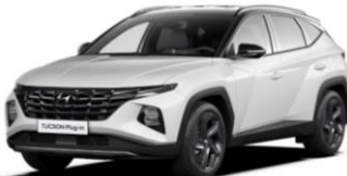
"Serenity White" perlamutrinė "Abyss Black" - juodas stogas (W60)