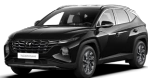
"Abyss Black" (A2B)