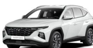
"Serenity White" (W6H), perlamutrinė