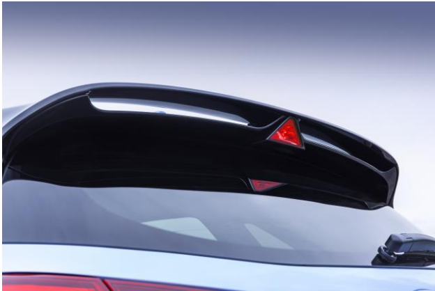
Trikampis STOP Žibintas integruotas į oro aptaklą