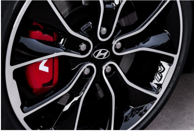
19 Colių Lengvo lydinio ratlankiai (tik Performance Pack)