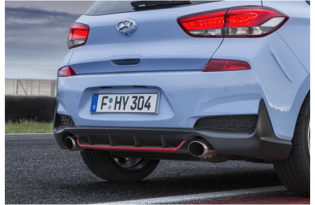
Dvigubas išmetimo sistemos vamzdis