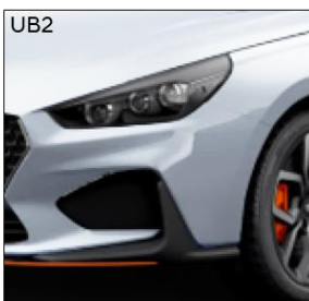
Clean slate (M)