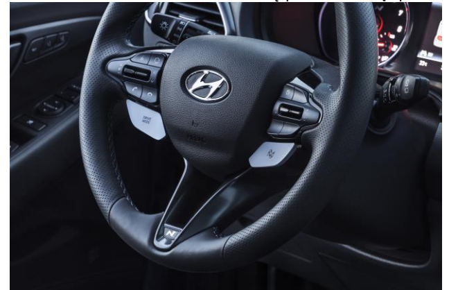
Sportinio stiliaus perforuotos odos vairas