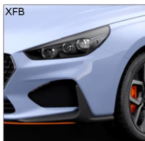
Performance Blue (S)