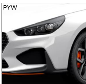
Polar White (S)