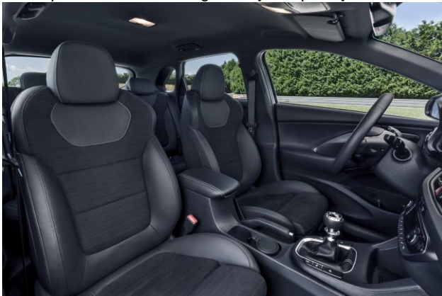
Sportinio stiliaus kombinuotos odos su tekstile arba zomša sėdynės