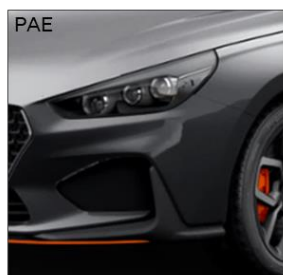
Phantom Black (P)