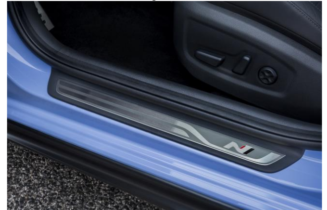
N lipimo slenksčių apdaila