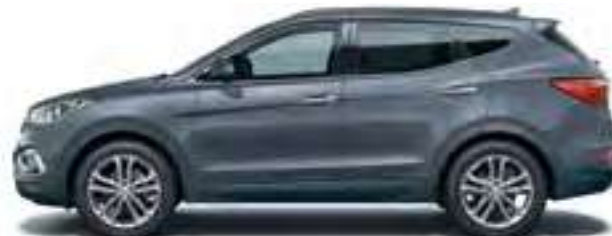
Ocean View (metalizuota spalva)