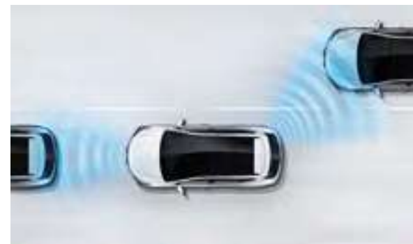
Aklosios zonos stebėjimo sistema (BSD). Galiniuose automobilio šonuose sumontuoti jutikliai aptinka artėjantį per veidrodėlius nematomą automobilį ir įjungia įspėjimo lemputę šoniniame veidrodėlyje bei garso signalą, jeigu yra įjungtas posūčio signalas. Galimas su „Style“ ir „Premium“ įranga.