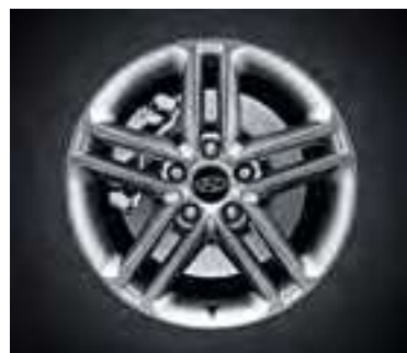
Comfort — 17", Light Grey