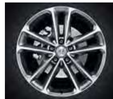
Premium — 19", Light Grey