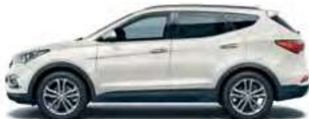
White Crystal (perlamutrinė spalva)