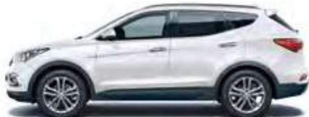
Pure White (bazinė spalva)

„Santa Fe“ galima rinktis iš patrauklių kėbulo spalvų įvairovės, skoningų salono spalvų derinių ir stilingų lengvo lydinio ratlankių. Įgaliotasis „Hyundai“ atstovas jums patars, kokie yra „Hyundai“ priedų privalumai, ir padės jus išsirinkti.