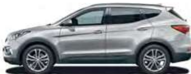
Platinum Silver (metalizuota spalva)