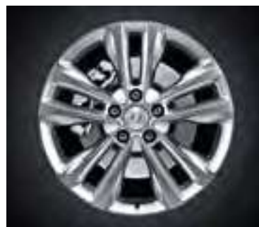
Style — 18", Hyper Silver