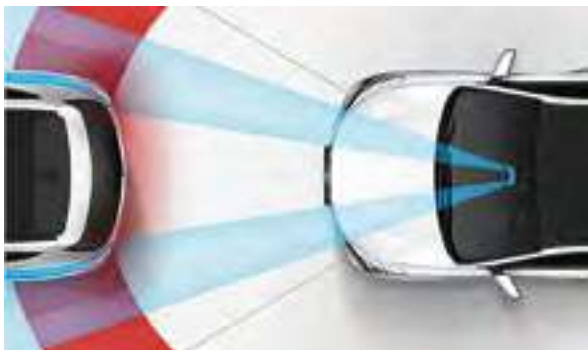
Autonominis avarinis stabdymas (AEB). Radiolokatoriaus ir vaizdo kamerų jutikliai aptinka galimą susidūrimą kelyje, įspėja vairuotoją ir, prireikus įjungia stabdžius, kad būtų išvengta arba sumažinta žala pėstiesiems ir kitiems automobiliams. Galimas su „Premium“ įranga.

„Santa Fe“ išvaizda kelia neabejotiną pasitikėjimą. Ji kuria protingos aktyvios saugos technologijos, suteikiančios vienodą apsaugą automobilio keleiviams ir pėstiesiems. Kasdienio važinėjimo palengvinimas yra esminis „Hyundai“ filosofijos elementas, o „Santa Fe“ puikiai atlieka šią užduotį. Galios šaltinis yra dizelinis variklis su 200 hp (147 kW) atiduodamąja galia ir šešių pavarų automatinė pavarų dėžė.