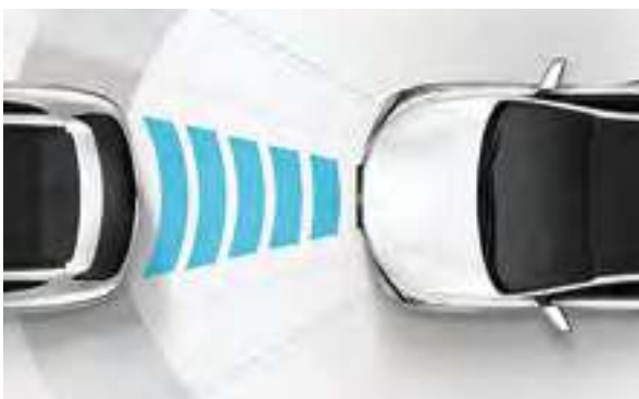
Pažangus, išmanusis pastovaus greičio valdymas. Ši sistema padidina saugumą ir sumažina įtampą, išlaikydama nustatytą atstumą iki priekyje važiuojančio automobilio, automatiškai sumažindama arba padidindama nustatytą greitį pagal eismo sąlygas. Galimas su „Premium“ įranga.