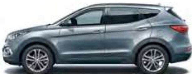
Titanium Silver (metalizuota spalva)