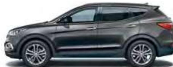
Phantom Black (perlamutrinė spalva)